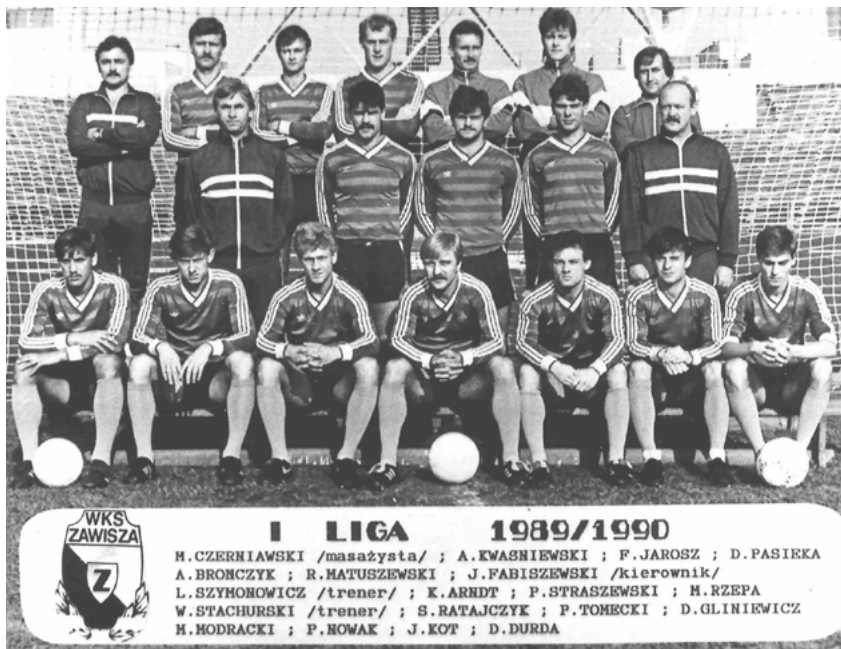
Zawisza Bydgoszcz, skład w sezonie 1989–1990.

która miała w składzie m.in. Szcześnego, Józwiaka, Bąka, Pisza i Koseckiego. Jako liderzy ligowej tabeli dostaliśmy w tym dniu nowy sprzęt z Holandii, od firmy Johana Cruyffa. Przez jakiś czas nikt nie myślał o samym meczu, tylko każdy próbował znaleźć dla siebie najlepsze dresy, buty, ortaliony. Słabo weszliśmy w ten mecz, Legia wykorzystała nasz słabszy moment i po bramkach Pisza i Łatki ograła nas 2:0. Po tym feralnym spotkaniu nasza gra pod koniec sezonu się posypała i skończyli-