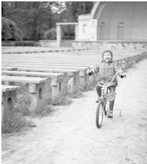
Spacer po parku Ludowym im. Wincentego Witosa. Ja na moim pierwszym rowerze przy nieistniejącej muszli koncertowej. 1974/1975 rok.

łam się, jak zręczne dłonie pracujących tam pań nanosiły pędzelkami kolorowe farby, brokat lub posypki imitujące śnieg. To były święta w samym środku lata, a ja byłam najszcześliwszym dzieckiem w mieście. Mimo konieczności zachowania tajemnicy i tak wszyscy później wiedzieli, gdzie byłam, bo za każdym razem wychodziłam z garścią nowiutkich bombek. Do dziś mam ich jeszcze kilka i kiedy dekoruję wigilijną choinkę, zawsze wspominam cuda z zakładu pana Webera.