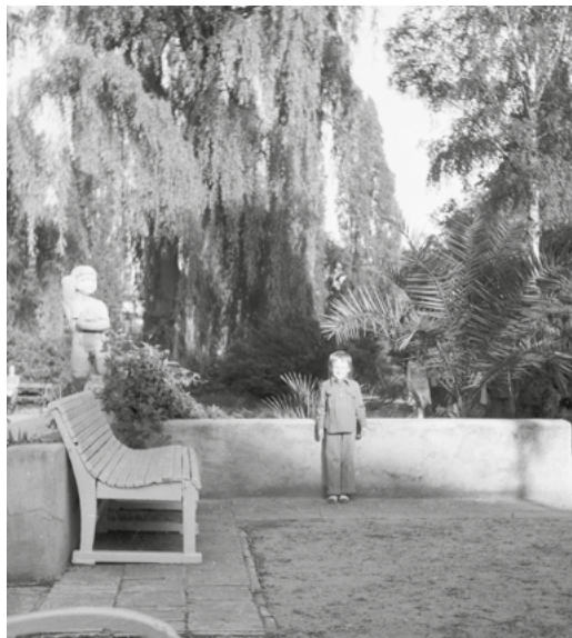
Spacer w ogrodzie botanicznym. Stoję na tle palmy. Okolo 1974 roku.

zadawałam to samo pytanie: „Babciu, pójdziemy do Piekarskich?”. Nie wiem dzisiaj, czy faktycznie tak nazywała się piekarnia, która dawała mi tyle radości. Znajdowała się również na Gdańskiej, kilka kamienic bliżej ulicy Chocimskiej niż narożna kamienica, w której znajdowała się piekarnia z cukiernią rodziny Bigońskich. Ale to właśnie u Piekarskich można było kupić bułki z ciasta rogalowego w kształcie ludzików. Były pyszne, puszyste i posypane makiem, a małe i zupełnie niereprezentacyjną piekarnię wspominam z rozrzewnieniem do dzisiaj, choć nie umiałabym wskazać dokładnie miejsca, w którym się znajdowała.