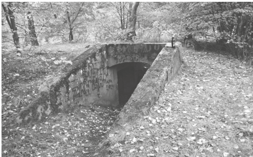
Przelotnia szczeliny przeciwlotniczej DAG, październik 2025 roku.

no go na podstawie dekretu Polskiego Komitetu Wyzwolenia Narodowego z dnia 31 sierpnia 1944 roku „o wymiarze kary dla faszystowsko-hitlerowskich zbrodniarzy winnych zabójstw i znęcania się nad ludnością cywilną i jeńcami oraz dla zdrajców Narodu Polskiego” – czyli na przykład osób, które podpisały volkslistę. Choć, jak wiadomo, pojęcie „zdrajcy narodu” może być bardzo szeroko, a nawet nadinterpretowane.