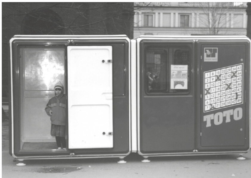
Pierwsza kolektura na placu Wolności, marzec 1991 roku.