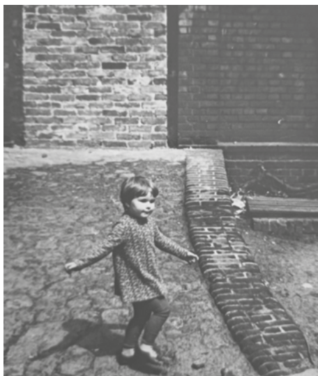
Mała Hania.