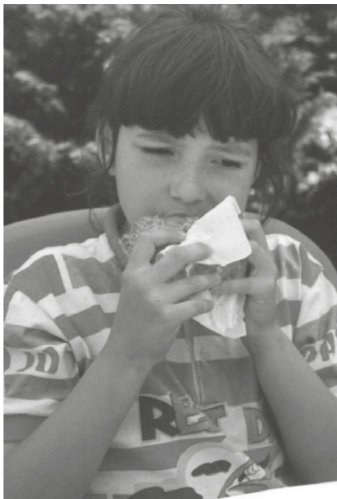
Czerwiec 1993 roku.

z faktu, iż w rodzinnym albumie zachowało się jedno jedyne zdjęcie, z czerwca 1993 roku, na którym, siedząc na plastikowym krześle, przy plastikowym stole, w koszulce polo z Tomem i Jerryem jadłam hamburgera w sezamowej bułce. Na stole stoi charakterystyczna zielona puszką z napojem sprite. Z innego zdjęcia wykonanego tego dnia wiem, że miałam wtedy na sobie również dekatyzowane dżinsy w gumkę i kolorowe trampki. Ot i cała ubraniowa esencja pierwszej połowy lat dziewięćdziesiątych.