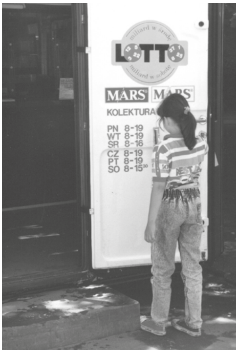
Czerwiec 1993 roku.

adres „Gdańska 18”, a w ewidencji kolektur – numer 7/41. Przy czym cyfra 7 oznaczała numer oddziału międzywojewódzkiego z siedzibą w Bydgoszczy, w skład którego to oddziału, oprócz naszego miasta, wchodziły też takie miejscowości, jak na przykład Piła czy Włocławek, a liczba 41 oznaczała tę konkretną kolekturę.