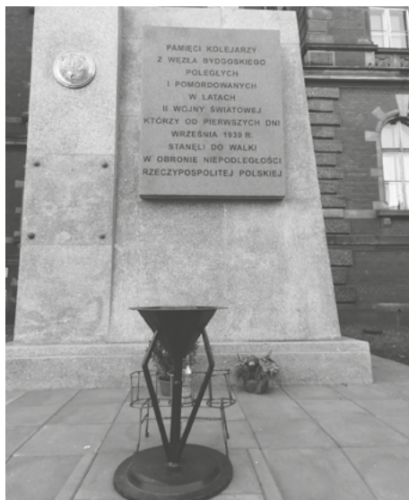
Przed głównym wejściem do pałacu stoi monument ku czci kolejarzy poległych i pomordowanych w czasie II wojny światowej. Znicz wykonał mój dziadzius.

uważać na pozostałych „zebrach”. Ale z dziadziusem Hania była bezpieczna. Poza tym, tak na wszelki wypadek, dziadek po drodze uczył, jak bezpiecznie przechodzić przez jezdnię. Nie wiem, ile tygodni tak wspólnie chodziliśmy do szkoły i z powrotem. Pewnego dnia trzeba było iść już bez dziadka, bo babcia potrzebowała opieki, a on nie chciał jej długo samej zostawiać. Wiele lat później dowiedziałam się, że jeszcze długo chodził za mną i obserwował, jak sobie radzę podczas tych, jak się później okazało, nie do końca samotnych wielkich wypraw.