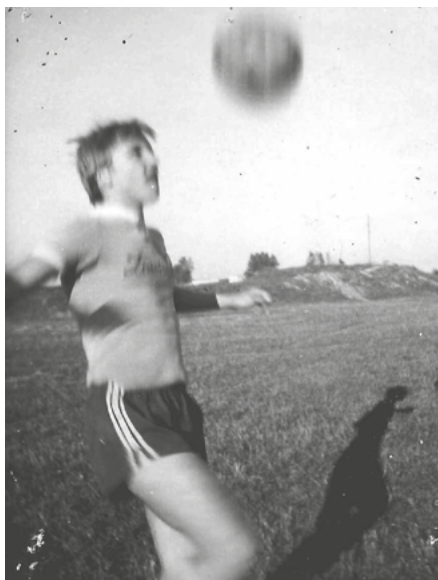
Na boisku Błękitnych Wójcin.

Pamiętam, jak będąc młodym chłopakiem, pierwszy raz wszedłem na obiekt Zawiszy Bydgoszcz, zobaczyłem stadion i pomyślałem, że zrobię wszystko, aby kiedyś zagrać wielki mecz na tej murawie. Musiało minąć kilka dobrych lat, nim na inaugurację pamiętnego se-