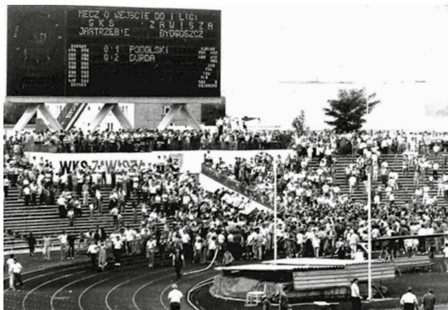
Zawisza Bydgoszcz – GKS Jastrzębie, koniec meczu.