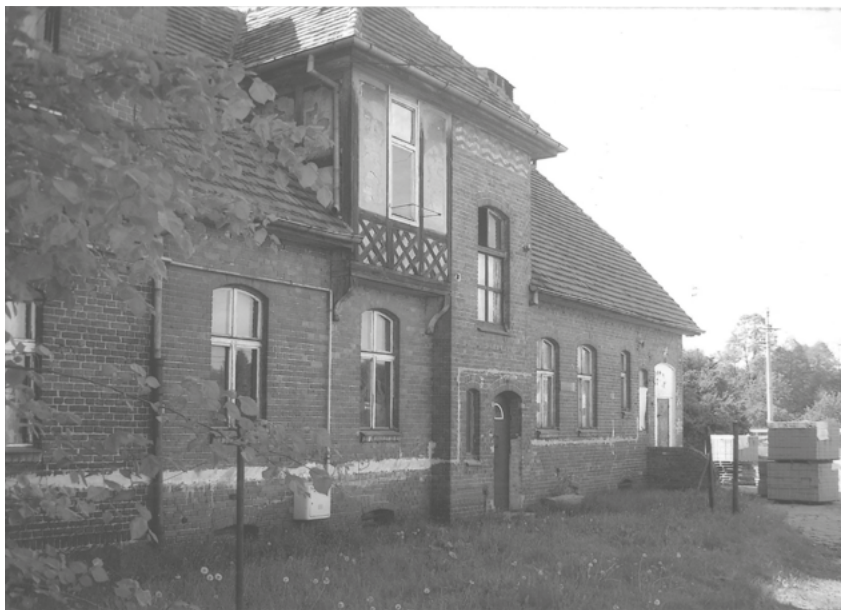
Budynek pruskiej, potem polskiej Szkoły Powszechnej przy ulicy Saperów 207 na Jachcicach, stan sprzed remontu, fot. wykonana przez autora w 2017 roku

ska różnych narodowości, w różnych okresach historycznych i zmian polityczno-ustrojowych, które dotknęły Jachcic, zabrał na zawsze do grobu.