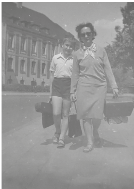
Mój trzynastoletni tata z moją babcią obok szkoły muzycznej, 1968 rok.

ła we mnie respekt. Podczas kąpieli w niej starałam się trzymać z daleka od „czarnej dziury” – miejsca z obitą białą emalią, podsycającego moją wyobraźnię najstraszniejszymi wizjami. Obok stała pralka, która pojawiła się tu nie tak znowu dawno. Wyparła umywalkę, której w ogóle w łazience nie było, a ujęcie wody musiało być skierowane rurą prosto do wanny. Pranie było więc procedurą, której nie dało się nie zauważyć, choć babcia twierdziła, że pralka to największy wynalazek ludzkości, i z rozbawieniem powtarzała: „Pralka