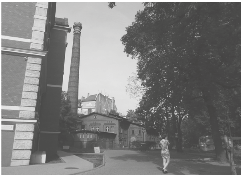
W odwiedzinach.

wiem flota ciężarówek nauki jazdy Ligi Obrony Kraju. Tak sobie myślę, że to musiały być diamenty – zwykle szkielka nie świecą przecież w słońcu aż tak.