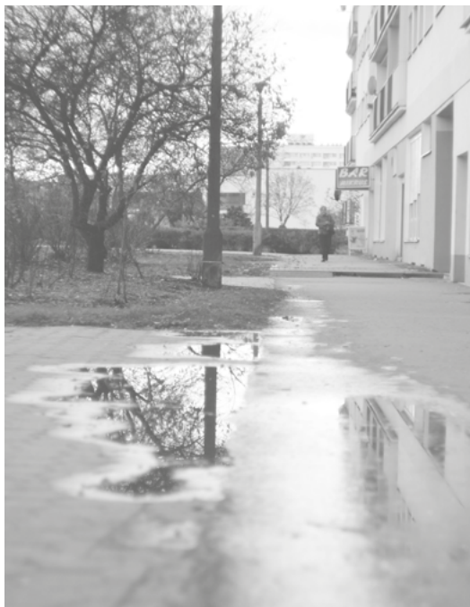
Bar Mikrus na parterze falowca przy ulicy Ludwika Waryńskiego 51, osiedle Błonie.

dził na park. Nieraz późnym, bardzo późnym wieczorem słyszałam żywe dyskusje, kłótnie, rozmowy, a nawet zdarzały się koncerty, w tym gitarowy. Nie zawsze było to dla mnie komfortowe. Jednak trzeba przyznać: w falowcu i okolicach nie wiało nudą.