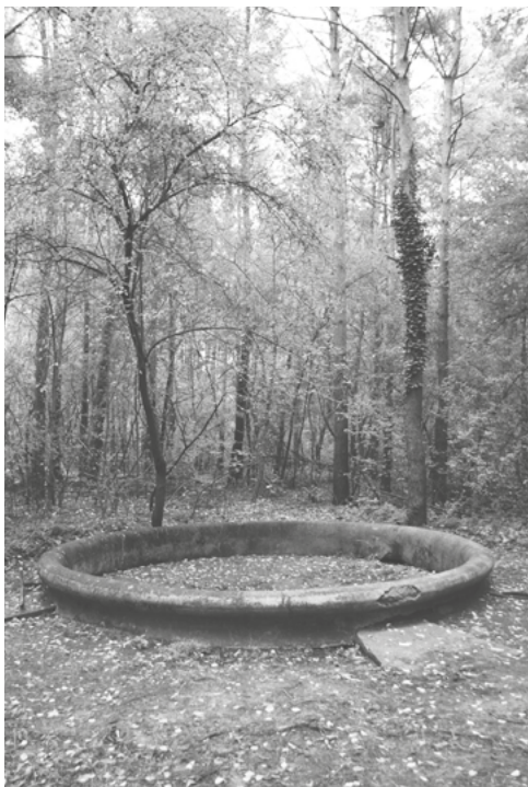
Fontanna DAG, październik 2025 roku.

cach) fabryce zbrojeniowej koncernu Dynamit Nobel AG w Trzeciej Rzeszy, to jest DAG Fabrik Bromberg. Sieć bunkrów ciągnęła się w lesie przy ulicach: Glinki, Szpitalna, Kliniczna (z pięknymi budynkami z ciemnej klinkierowej cegły, zaprojektowanymi przez modernistycznego architekta Carla Staudta, należącymi niegdyś do niemieckiej kadry kierowniczo-inżynierskiej DAG – podobnymi do tych przy ulicy Świetlicowej w Łęgnowie), Solna, 15. Dywizji Piechoty Wielkopolskiej. W pobliżu tej