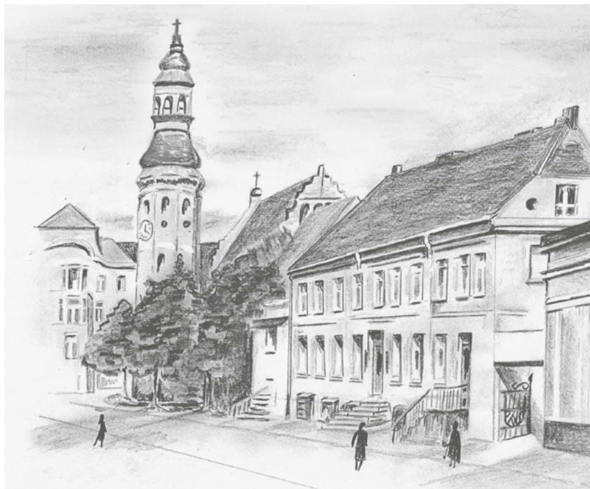
Dawna drukarnia Gruenauera, z kutą bramą na dziedziniec, XX wiek (w tle kościół Klarysek). Szkic autorstwa Ewy Budny

a już dziewięć lat później, w 1815 roku, otworzył nowoczesny budynek drukarni przy ulicy Jagiellońskiej 1, na terenie dawnego ogrodu sióstr klarysek.