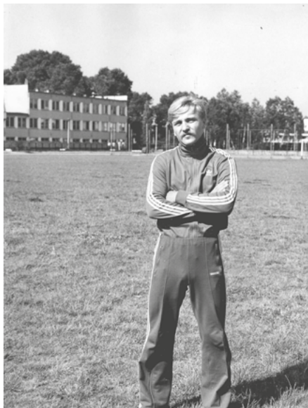
Początek lat 80., boczne boisko Zawiszy Bydgoszcz.