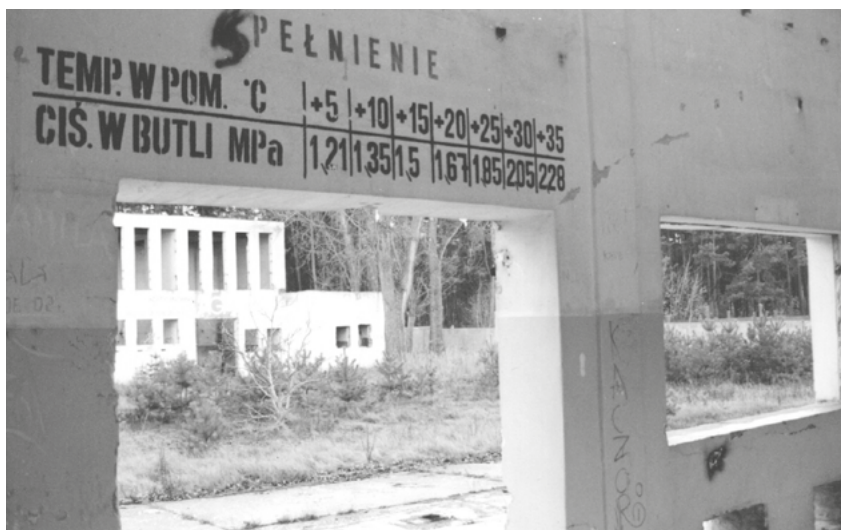
Ruiny acetylenowni BPI, zdjęcie archiwalne.

Ów obóz pracowniczy stanowił element części zachodniej DAG-u, zwanej DAG Kaltwasser, od znajdującej się na terenie dzisiejszych Kapuścisk połęderskiej Kolonii Zimne Wody – Colonie Kaltwasser, o mocno rozprozonej zabudowie. Za moich czasów niedaleko fontanny obecne były jeszcze ruiny dawnej – ale już polskiej – acetylenowni Bydgoskiego Przedsiębiorstwa Instalacyjnego, w których z chęcią praktykowałam urbex avant la lettre.