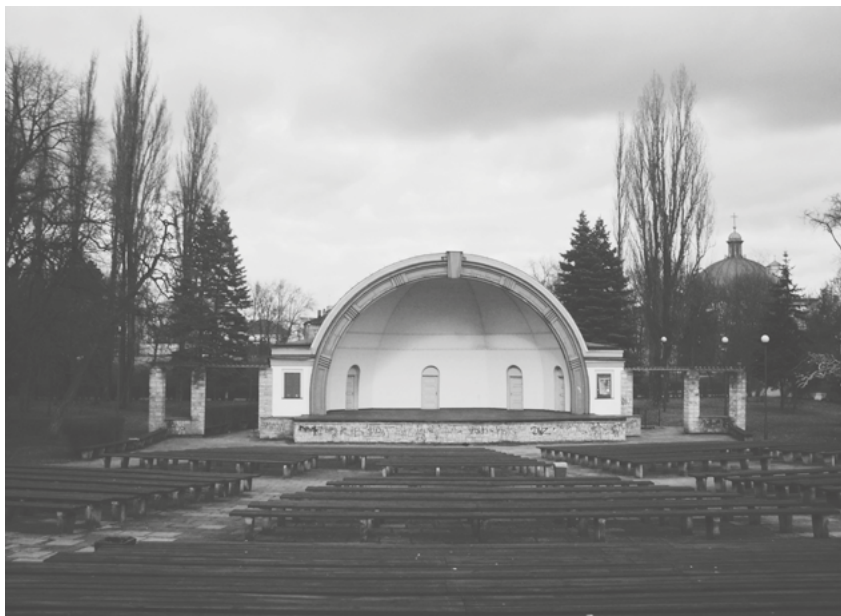
Muszla koncertowa w parku im. Wincentego Witosa. Fot. Maja Butkiewicz

Pasowała do krajobrazu, do tego miejsca. Po prostu. Obecnie, gdy spaceruję po parku, nadal nie umiem pogodzić się i przyzwyczać wzroku do tego, że muszla koncertowa nie istnieje.