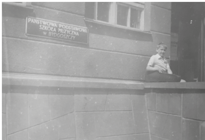
Mój tata obok szkoły muzycznej.

tali. Potem koniecznie łańcuchów. I autodrom – też z dziadkiem! Były jeszcze krzywe zwierciadła, ogromna zjeżdżalnia i oczywiście balony z helem (kiedy zielony królik, już na Osiedlu Leśnym, wybrał los podniebnego podróżnika, musieliśmy wracać po drugi balon, tym razem różowego kota). Była też tradycyjna mała karuzela ze zwierzętami i parę atrakcji, które zapewne wyzwalały więcej adrenaliny, ale w ich stronę nawet nie patrzyłam. Czasem jeździliśmy też do zoo, skąd najlepiej pamiętam niedźwiedzie, dziki i liczne zwierzęta kopytne.