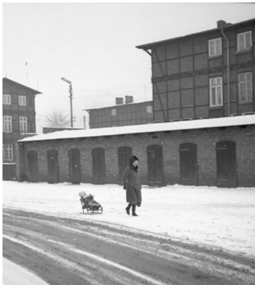
Zima na Chocimskiej. Londynek, 1970 rok.

dzielnym wejściem dla mieszkańców. W tym dawnym wejściu dzisiaj znajduje się Jadłodzielnia. Po prawej stronie bramy był fryzjer, w którym czasem strzygła się moja mama, oraz bar mleczny, do którego czasem chodziliśmy na pie-rogi. Babcia z dziadkiem mieszkali na trzecim piętrze, zajmując mieszkanie z balkonem od strony ulicy. Ponieważ w mieszkaniu mieszkała również ciocia z wujkiem i moim kuzynem Markiem, nie był to czas luksusów. Wszyscy razem zajmowaliśmy dwa pokoje. Babcia i dziadek w jednym pokoju z nami, a ciocia z wujkiem i kuzynem w drugim. Nasz pokój podzielony był na pół szafą czy meblościanką dostępną od