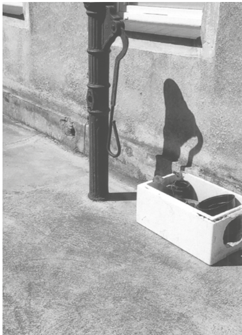
Pompa abisyńska na podwórzu posesji przy ulicy Średniej 19

dokumenty, ale też tylko punkty geograficzne na starych mapach.