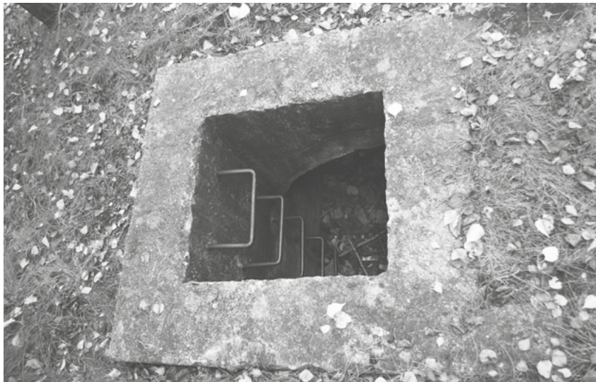
Szyb szczeliny przeciwlotniczej DAG, październik 2025 roku.

ne, niezasypane albo niezamknięte pancernymi drzwiami przejście i na przykład wejść do szczeliny przeciwlotniczej od góry, szybem, po stalowej drabince kłamrowej, a wynurzyć się w już całkiem innym miejscu z przelotni, niczym pociąg z ciemnego tunelu. Pamiętam też, że raz, już w porze zmierzchu, widzieliśmy tutaj ze znajomymi rozjarzone larwy świetlików. Myśleliśmy wtedy, że gąsienice te napromieniował pobliski Zachem.