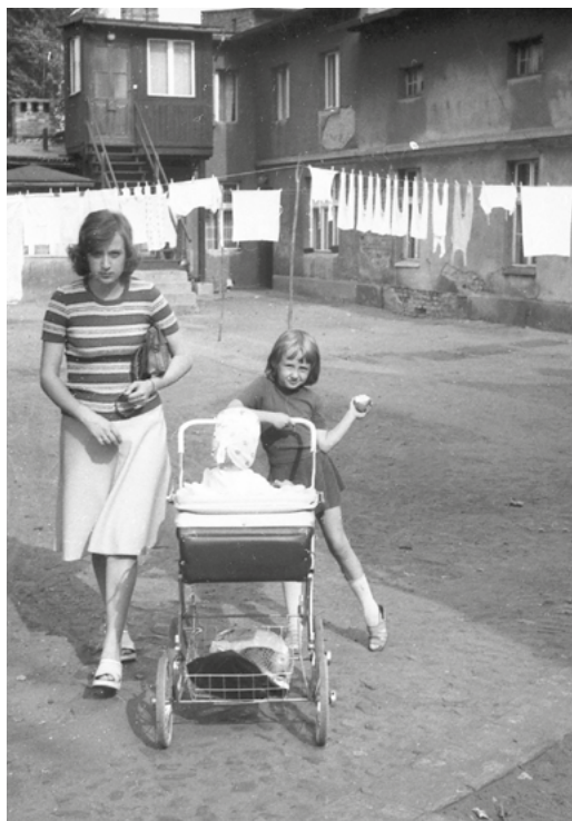
Pranie na podwórku przy Chocimskiej 22. 1975 rok.

Postać Marii z obrazu zajmującego centralną część ołtarza, w otoczeniu dwóch masywnych postaci patronów kościoła i zamknięta charakterystycznymi, grubaśnymi złotymi kolumnami, pozwalała mi niemal zatracać się w atmosferze nabożeństwa, bez konieczności rozumienia jego treści. Tłum otaczający mnie z każdej strony sprawiał, że niezależnie od pory roku w kościele niemal zawsze było mi ciepło. Zimą