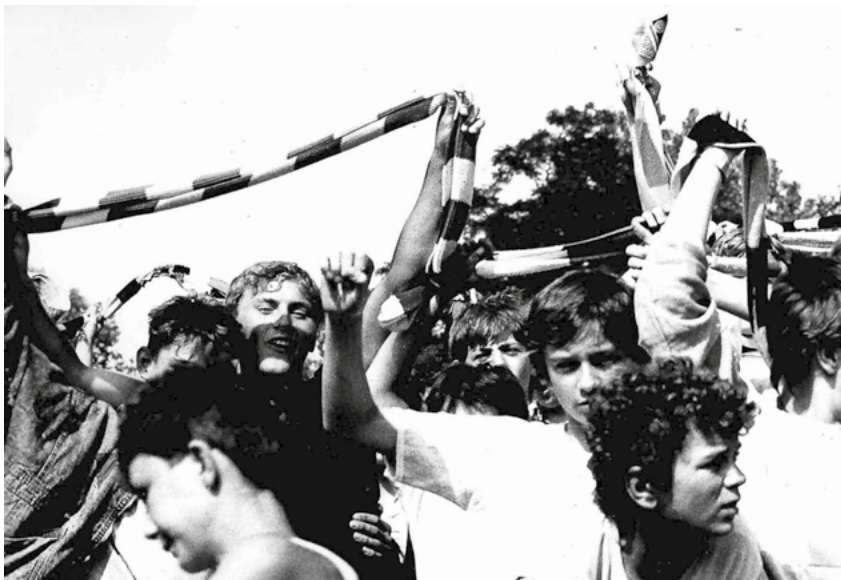
Zawisza Bydgoszcz – GKS Jastrzębie, kibice po meczu barażowym.

Wójcini i pamiętam jak dziś mecz z Cukrownikiem Tuczno. Przed meczem otrzymaliśmy nowe dresy, co było wielkim powodem naszego zadowolenia. Dresy były zielone, a drużyna nazywała się Błękitni, więc wyglądaliśmy niestety trochę komicznie. Na sam mecz pojechaliśmy około pięćdziesięciu kilometrów dziurawą drogą pojazdem marki Lublin z plandeką, siedząc na ławkach na pace auta tyłem do kierunku jazdy, co u kilku kolegów spowodowało spadek formy przed meczem. Same zawody też miały swój specyficzny przebieg. Strzeliłem pierwszą i ostatnią bramkę w tym meczu. Niestety przegraliśmy, a między moimi