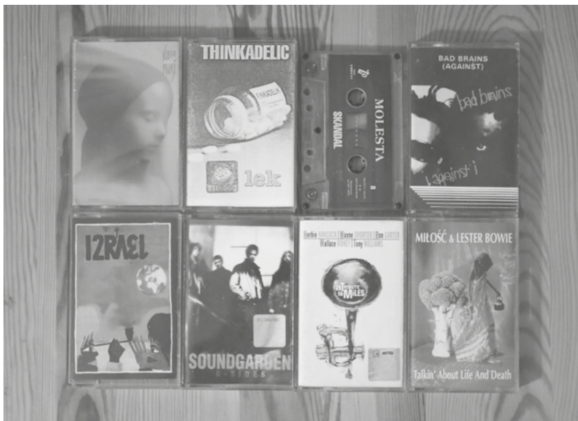
Wspomniane w tekście kasyety z kolekcji autora.

Wróćmy jednak do sedna sprawy. Do wnętrza mrówkowca prowadziło kilka wejść umieszczonych z trzech stron budynku. Przy niektórych powstały niewielkie punkty handlowe lub usługowe, a jeden z nich zajmował się sprzedażą kaset magnetofonowych. Było to jeszcze przed ustawą, która w 1994 roku uregulowała kwestie związane z prawem autorskim, więc wybór był niezły, a ceny umiarkowane. To właśnie w tym niewielkim sklepiku kupiłem dwukasetowe wydawnictwo z piosenkami popularnego wówczas boysbandu New Kids On The Block (w skrócie NKOTB). Trudno mi dziś ustalić, jakie dokładnie albumy zawie-