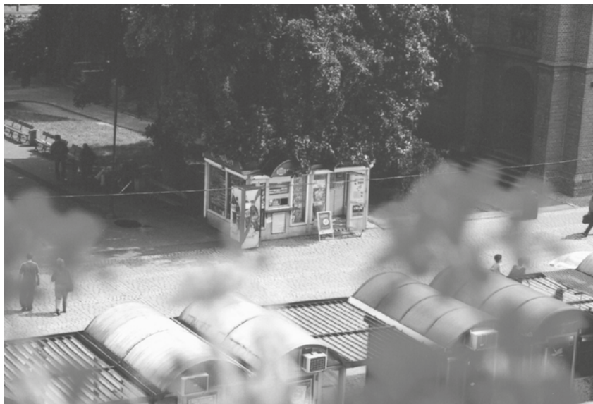
Kolektura 7/41 na placu Wolności z balkonu redakcji „Gazety Wyborczej”, XXI wiek.

agowaliśmy najdzikszym piskiem, jaki tylko można było z siebie wydobyć, jakby był co najmniej gwiazdą muzyki pop. Ale gwiazda była tego wieczoru zupełnie inna – gałę uświetniającą wprowadzenie w nasz kraj lottomatów rozjaśniła swoją obecnością sama natapirowana Samantha Fox, wykonując z playbacku swój wielki hit „Touch Me”. Pamiętam, że występ zaczynała z półobrotu, coś jej się z tego powodu rozsynchronizowało i słowa „oh, touch me” wypowiedziała do mikrofonu zbyt wcześnie – muzyka puszczona została z sekundowym interwałem. Zresztą, mam to wszystko nagrane na kasetę VHS. No, ale każdemu może się zdarzyć. Nawet Samancie Fox. Zwłaszcza na gali lottomatów.